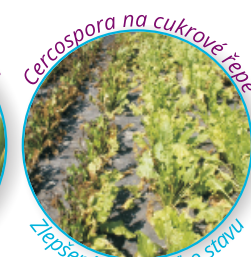
Cercospora na cukrové řepě