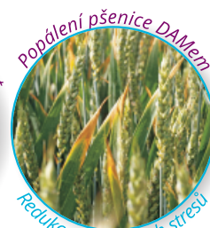
Podání pšenice DAMem