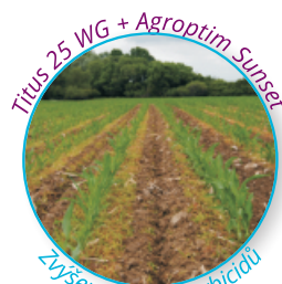
Zvýšení účinku herbicidů